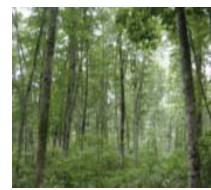
広葉樹の植栽、獣害対策

※ 森林組合・林業事業者に対し、里山の再生のため新たに県が設定する単価により一定額を助成します。