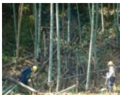
人工林に侵入した、竹の伐採、整理