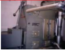
公共施設のボイラー

定額(標準的な単価) バイオマス利用量:5万円/m 3 (間伐材の利用量に応じた支援)