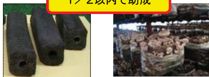
木炭や竹、きのこ等生産加工施設