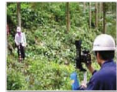
間伐のための境界特定