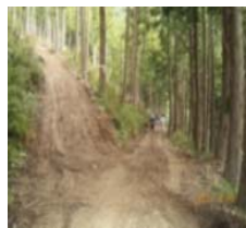
作業道・作業路の作設