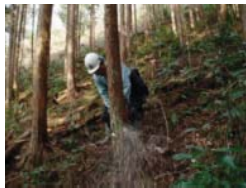
間伐の実施や林道までの搬出