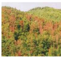
被害木の伐倒、薬剤処理や防除